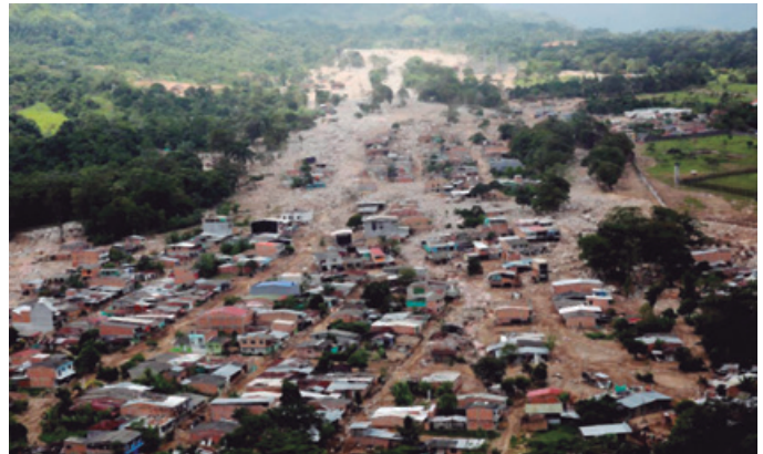
Figura 2. Vista aérea de los efectos de las avenidas torrenciales de 2017 en la ciudad de Mocoa, Putumayo (Colombia). Murieron 332 personas y casi 1.500 viviendas fueron afectadas.

- BRASIL: En el periodo comprendido entre 1991-2012 se han registrado 12.750 eventos de inundaciones que han generado 2.800 víctimas mortales (UFSC, 2013; Mikoz, 2017), lo que equivale a una media de 133 víctimas anuales por este tipo de procesos. Los movimientos en masa, para el mismo periodo, han registrado 539 víctimas en 699 eventos (USF, 2013), lo que representa una media de 26 víctimas cada año. Otros procesos, tales como la erosión (349 eventos