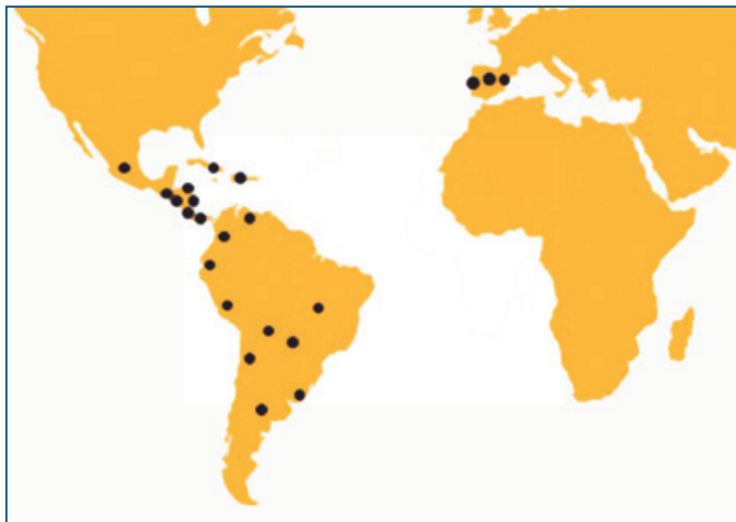
Figura 1. La Asociación de Servicios de Geología y Minería Iberoamericanos (ASGMI) cuenta con 22 socios: Argentina, Bolivia, Brasil, Chile, Colombia, Costa Rica, Cuba, Ecuador, El Salvador, España (y la región de Cataluña), Guatemala, Honduras, México, Nicaragua, Panamá, Paraguay, Perú, Portugal, República Dominicana, Uruguay y Venezuela.

Figure 1. The 22 countries belonging to the Association of the Geological and Mining Surveys of Iberoamerica (ASGMI): Argentina, Bolivia, Brazil, Chile, Colombia, Costa Rica, Cuba, Ecuador, El Salvador, Spain (and the region of Catalonia), Guatemala, Honduras, Mexico, Nicaragua, Panama, Peru, Portugal, Dominican Republic, Uruguay and Venezuela.