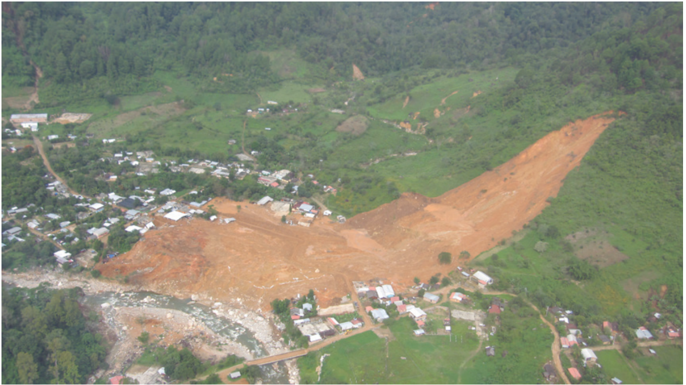
Figura 3. Deslizamiento en La Pintada (México), ocurrido en septiembre de 2013 tras el paso de la tormenta tropical Manuel. Hubo 86 víctimas mortales y graves afectaciones a viviendas e infraestructuras.