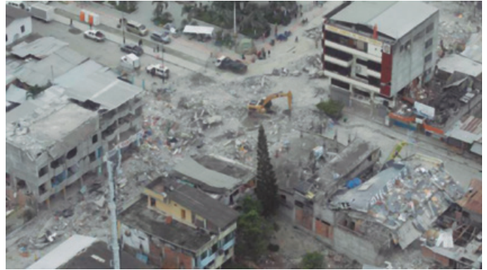
Figura 4. Terremoto del 16 de abril de 2016 (7,8 Mw) con epicentro entre las parroquias Pedernales y Cojimíes (Ecuador). Causó 671 víctimas mortales, más de 6.000 heridos y 80.000 personas afectadas. El sismo destruyó el 70% de las edificaciones en Pedernales.

Colombia también es un país a destacar donde el Servicio Geológico Colombiano (SGC) opera las redes sismológicas y acelerográficas nacionales, con 60 estaciones sismológicas satelitales y 122 acelerógrafos. Además, dispone de tres Observatorios Volcanológicos que monitorea e investiga 23 estructuras volcánicas con redes multiparamétricas (geofísica, geodésica, geoquímica y geovulcanológica), a través